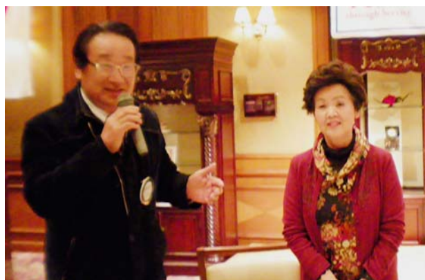
古希の相澤会員ご夫妻